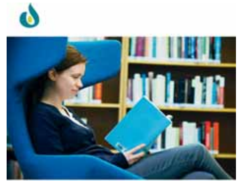
ERSTA SKÖNDAL HÖGSKOLA / ERSTA SKÖNDAL UNIVERSITY COLLEGE ÅRSBERÄTTELSE / ANNUAL REPORT 2008