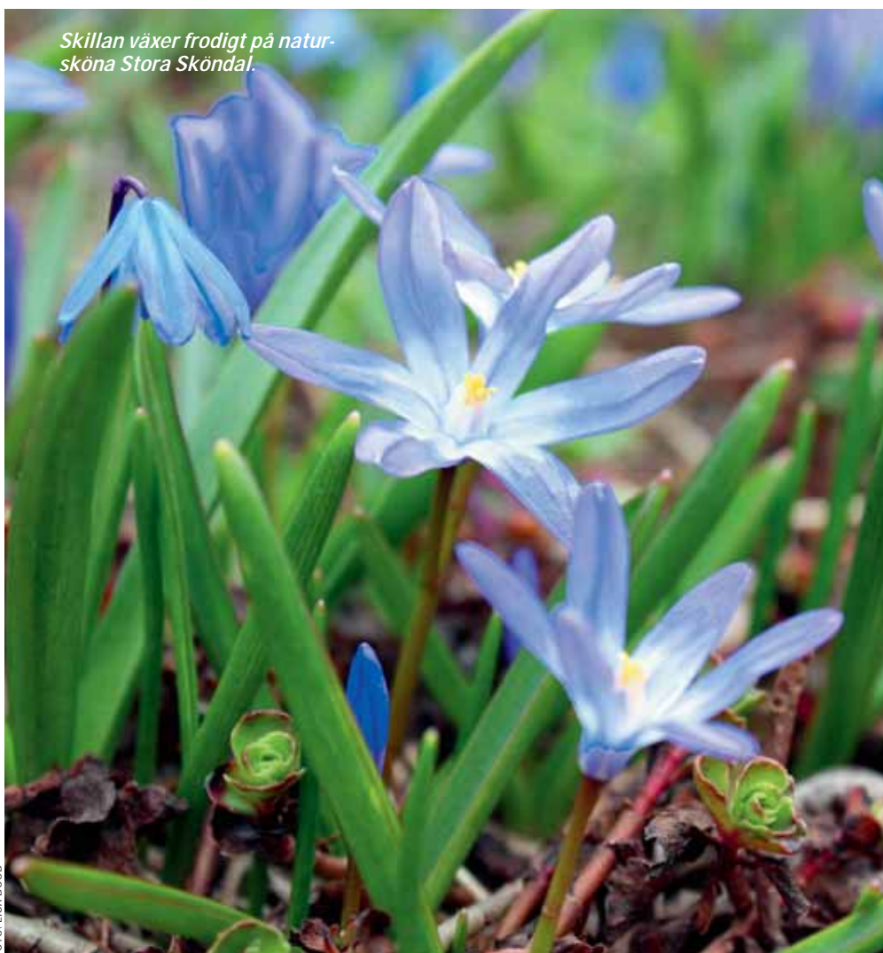
Skillan växer frodigt på natur-sköna Stora Sköndal.

På sista sidan i boken Tankestoff står det: Får vi leva tillräckligt länge blir vi säkert, som det står i Skriften, – trötta av dagar och år, och är glada att få bryta upp och gå vidare.